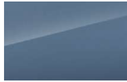
Niebieski Tain Qing